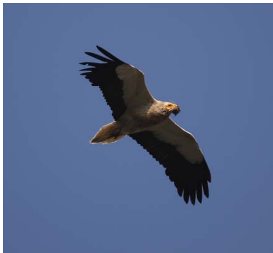
Alimoche adulto en vuelo con carroña en el pico

El alimoche ( Neophron percnopterus ) es una de las cuatro especies de buitres que se encuentran en la península. En Andalucía la especie está catalogada "en peligro crítico de extinción" y cuenta con una población reproductora de menos de 35 parejas. Una de las medidas más importantes de gestión ha sido el aporte diario de carroña a un muladar de la Sierra de Cazorla, Segura y Las Villas para tratar de formar un dormitorio de alimoches inmaduros que posteriormente y una vez alcanzada la madurez sexual establezcan sus territorios de cría en el Parque Natural.